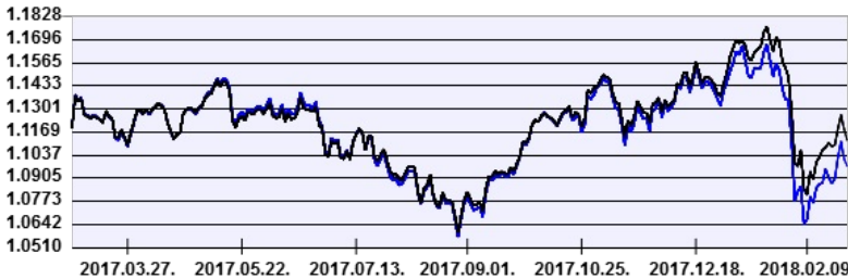
EGY JEGYRE JUTÓ NETTÓ ESZKÖZÉRTÉK, 2017.03.01 - 2018.02.28

----- Aegon Nemzetközi Részvény Befektetési Alap EUR sorozat ----- Benchmark