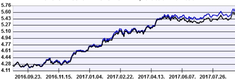
EGY JEGYRE JUTÓ NETTÓ ESZKÖZÉRTÉK, 2016.09.01 - 2017.08.31

--- Aegon Közép-Európai Részvény Befektetési Alap HUF sorozat --- Benchmark