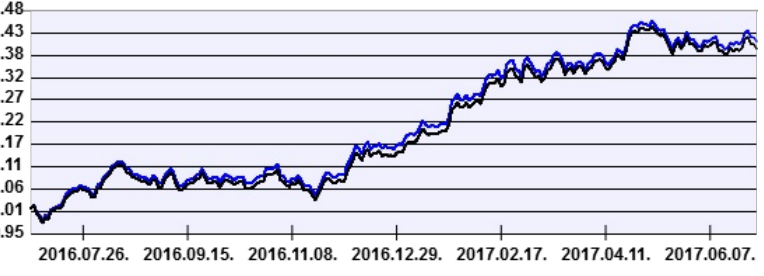
EGY JEGYRE JUTÓ NETTÓ ESZKÖZÉRTÉK, 2016.07.01 - 2017.06.30

A múltbeli hozamok nem jelentenek garanciát az alap jövőbeli teljesítményére nézve. Jelen hirdetés nem minősül ajánlattételnek vagy befektetési tanácsadásnak. A befektetés részletes feltételeit az Alap Tájékoztatója tartalmazza, mely a mindenkor érvényes kondíciós listákkal együtt megtalálható a forgalmazási helyeken. A befektetési alap forgalmazásával (vétel, tartás, eladás) kapcsolatos költségek az alap kezelési szabályzatában és a forgalmazási helyeken megismerhetők.