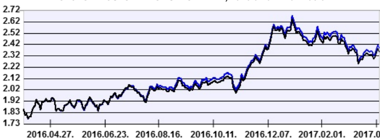
EGY JEGYRE JUTÓ NETTÓ ESZKÖZÉRTÉK, 2016.04.01 - 2017.03.31

— Aegon Russia Részvény Befektetési Alap intézményi sorozat — Benchmark