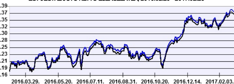
EGY JEGYRE JUTÓ NETTÓ ESZKÖZÉRTÉK, 2016.02.29 - 2017.02.28

— Aegon Nemzetközi Részvény Befektetési Alap HUF sorozat — Benchmark