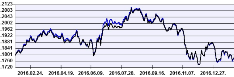
EGY JEGYRE JUTÓ NETTÓ ESZKÖZÉRTÉK, 2016.02.01 - 2017.01.31

— Aegon Lengyel Kötvény Befektetési Alap intézményi sorozat — Benchmark