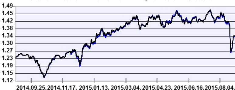
— Aegon Nemzetközi Részvény Befektetési Alap intézményi sorozat — Benchmark

A múltbeli hozamok nem jelentenek garanciát az alap jövőbeli teljesítményére nézve. Jelen hirdetés nem minősül ajánlattételnek vagy befektetési tanácsadásnak. A befektetés részletes feltételeit az Alap Tájékoztatója tartalmazza, mely a mindenkor érvényes kondíciós listákkal együtt megtalálható a forgalmazási helyeken. A befektetési alap forgalmazásával (vétel, tartás, eladás) kapcsolatos költségek az alap kezelési szabályzatában és a forgalmazási helyeken megismerhetők.