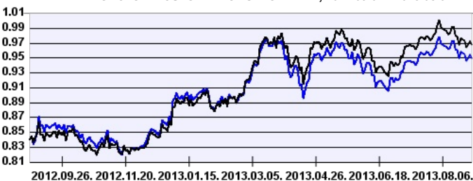
EGY JEGYRE JUTÓ NETTÓ ESZKÖZÉRTÉK, 2012.09.01 - 2013.08.31

----- AEGON Nemzetközi Részvény Befektetési Alap HUF sorozat ----- Benchmark