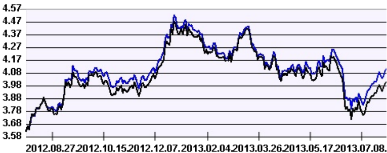
EGY JEGYRE JUTÓ NETTÓ ESZKÖZÉRTÉK, 2012.08.01 - 2013.07.31