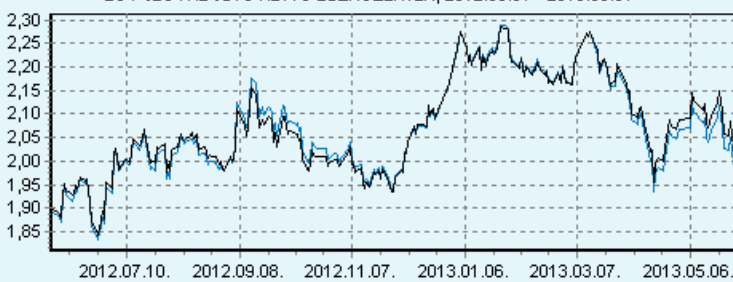
EGY JEGYRE JUTÓ NETTÓ ESZKÖZÉRTÉK, 2012.06.01 - 2013.05.31

A múltbeli hozamok nem jelentenek garanciát az alap jövőbeli teljesítményére nézve. Jelen hirdetés nem minősül ajánlattételnek vagy befektetési tanácsadásnak. A befektetés részletes feltételeit az Alap Tájékoztatója tartalmazza, mely a mindenkor érvényes kondíciós listákkal együtt megtalálható a forgalmazási helyeken. A befektetési alap forgalmazásával (vétel, tartás, eladás) kapcsolatos költségek az alap kezelési szabályzatában és a forgalmazási helyeken megismerhetők.