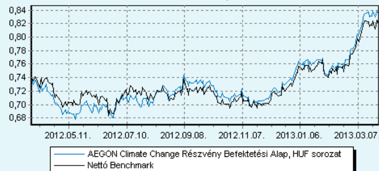
EGY JEGYRE JUTÓ NETTÓ ESZKÖZÉRTÉK, 2012.04.01 - 2013.03.31

Az alapok múltbeli teljesítménye nem nyújt garanciát a jövőbeli hozamok nagyságára. Jelen hirdetés nem minősül ajánlattételnek vagy befektetési tanácsadásnak. A befektetés részletes feltételeit az Alap Tájékoztatója tartalmazza, mely a mindenkor érvényes kondíciós listákkal együtt megtalálható a forgalmazási helyeken. A befektetési alap forgalmazásával (vétel, tartás, eladás) kapcsolatos költségek az alap kezelési szabályzatában és a forgalmazási helyeken megismerhetők.