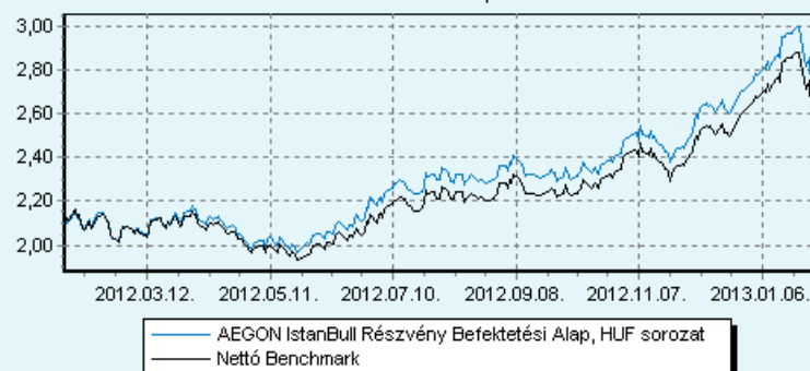
EGY JEGYRE JUTÓ NETTÓ ESZKÖZÉRTÉK, 2012.02.01 - 2013.01.31

Az alapok múltbeli teljesítménye nem nyújt garanciát a jövőbeli hozamok nagyságára. Jelen hirdetés nem minősül ajánlattételnek vagy befektetési tanácsadásnak. A befektetés részletes feltételeit az Alap Tájékoztatója tartalmazza, mely a mindenkor érvényes kondíciós listákkal együtt megtalálható a forgalmazási helyeken. A befektetési alap forgalmazásával (vétel, tartás, eladás) kapcsolatos költségek az alap kezelési szabályzatában és a forgalmazási helyeken megismerhetők.