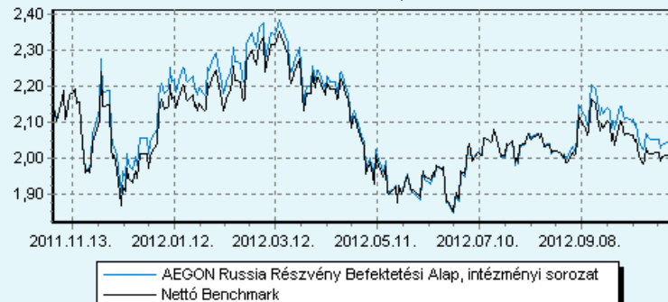
EGY JEGYRE JUTÓ NETTÓ ESZKÖZÉRTÉK, 2011.11.01 - 2012.10.31

Az alapok múltbeli teljesítménye nem nyújt garanciát a jövőbeli hozamok nagyságára. Jelen hirdetés nem minősül ajánlattételnek vagy befektetési tanácsadásnak. A befektetés részletes feltételeit az Alap Tájékoztatója tartalmazza, mely a mindenkor érvényes kondíciós listákkal együtt megtalálható a forgalmazási helyeken. A befektetési alap forgalmazásával (vétel, tartás, eladás) kapcsolatos költségek az alap kezelési szabályzatában és a forgalmazási helyeken megismerhetők.