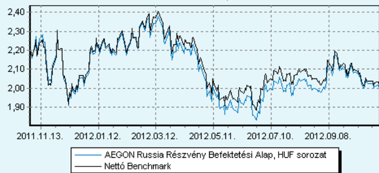
EGY JEGYRE JUTÓ NETTÓ ESZKÖZÉRTÉK, 2011.11.01 - 2012.10.31

Az alapok múltbeli teljesítménye nem nyújt garanciát a jövőbeli hozamok nagyságára. Jelen hirdetés nem minősül ajánlattételnek vagy befektetési tanácsadásnak. A befektetés részletes feltételeit az Alap Tájékoztatója tartalmazza, mely a mindenkor érvényes kondíciós listákkal együtt megtalálható a forgalmazási helyeken. A befektetési alap forgalmazásával (vétel, tartás, eladás) kapcsolatos költségek az alap kezelési szabályzatában és a forgalmazási helyeken megismerhetők.