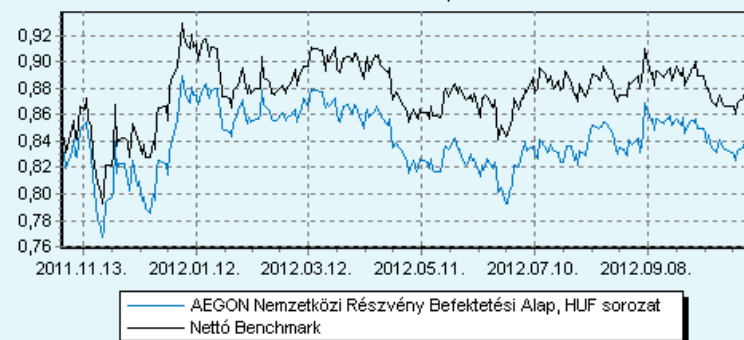
EGY JEGYRE JUTÓ NETTÓ ESZKÖZÉRTÉK, 2011.11.01 - 2012.10.31

Az alapok múltbeli teljesítménye nem nyújt garanciát a jövőbeli hozamok nagyságára. Jelen hirdetés nem minősül ajánlattételnek vagy befektetési tanácsadásnak. A befektetés részletes feltételeit az Alap Tájékoztatója tartalmazza, mely a mindenkor érvényes kondíciós listákkal együtt megtalálható a forgalmazási helyeken. A befektetési alap forgalmazásával (vétel, tartás, eladás) kapcsolatos költségek az alap kezelési szabályzatában és a forgalmazási helyeken megismerhetők.