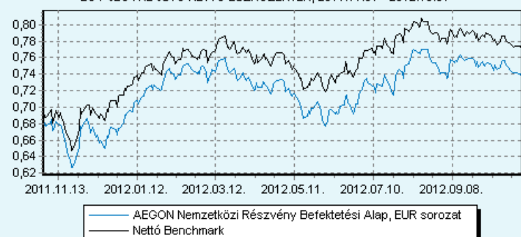
EGY JEGYRE JUTÓ NETTÓ ESZKÖZÉRTÉK, 2011.11.01 - 2012.10.31

Az alapok múltbeli teljesítménye nem nyújt garanciát a jövőbeli hozamok nagyságára. Jelen hirdetés nem minősül ajánlattételnek vagy befektetési tanácsadásnak. A befektetés részletes feltételeit az Alap Tájékoztatója tartalmazza, mely a mindenkor érvényes kondíciós listákkal együtt megtalálható a forgalmazási helyeken. A befektetési alap forgalmazásával (vétel, tartás, eladás) kapcsolatos költségek az alap kezelési szabályzatában és a forgalmazási helyeken megismerhetők.