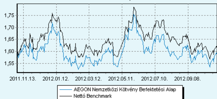
EGY JEGYRE JUTÓ NETTÓ ESZKÖZÉRTÉK, 2011.11.01 - 2012.10.31

Az alapok múltbéli teljesítménye nem nyújt garanciát a jövőbeli hozamok nagyságára. Jelen hirdetés nem minősül ajánlattételnek vagy befektetési tanácsadásnak. A befektetés részletes feltételeit az Alap Tájékoztatója tartalmazza, mely a mindenkor érvényes kondíciós listákkal együtt megtalálható a forgalmazási helyeken. A befektetési alap forgalmazásával (vétel, tartás, eladás) kapcsolatos költségek az alap kezelési szabályzatában és a forgalmazási helyeken megismerhetők.