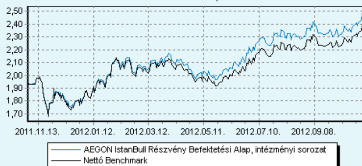
EGY JEGYRE JUTÓ NETTÓ ESZKÖZÉRTÉK, 2011.11.01 - 2012.10.31

Az alapok múltbeli teljesítménye nem nyújt garanciát a jövőbeli hozamok nagyságára. Jelen hirdetés nem minősül ajánlattételnek vagy befektetési tanácsadásnak. A befektetés részletes feltételeit az Alap Tájékoztatója tartalmazza, mely a mindenkor érvényes kondíciós listákkal együtt megtalálható a forgalmazási helyeken. A befektetési alap forgalmazásával (vétel, tartás, eladás) kapcsolatos költségek az alap kezelési szabályzatában és a forgalmazási helyeken megismerhetők.