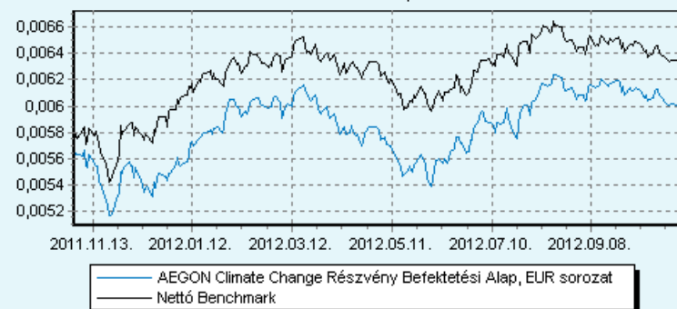
EGY JEGYRE JUTÓ NETTÓ ESZKÖZÉRTÉK, 2011.11.01 - 2012.10.31

Az alapok múltbeli teljesítménye nem nyújt garanciát a jövőbeli hozamok nagyságára. Jelen hirdetés nem minősül ajánlattételnek vagy befektetési tanácsadásnak. A befektetés részletes feltételeit az Alap Tájékoztatója tartalmazza, mely a mindenkor érvényes kondíciós listákkal együtt megtalálható a forgalmazási helyeken. A befektetési alap forgalmazásával (vétel, tartás, eladás) kapcsolatos költségek az alap kezelési szabályzatában és a forgalmazási helyeken megismerhetők.