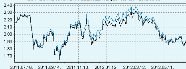
EGY JEGYRE JUTÓ NETTÓ ESZKÖZÉRTÉK, 2011.07.01 - 2012.06.30

Az alapok múltbeli teljesítménye nem nyújt garanciát a jövőbeli hozamok nagyságára. Jelen hirdetés nem minősül ajánlattételnek vagy befektetési tanácsadásnak. A befektetés részletes feltételeit az Alap Tájékoztatója tartalmazza, mely a mindenkor érvényes kondíciós listákkal együtt megtalálható a forgalmazási helyeken. A befektetési alap forgalmazásával (vétel, tartás, eladás) kapcsolatos költségek az alap kezelési szabályzatában és a forgalmazási helyeken megismerhetők.