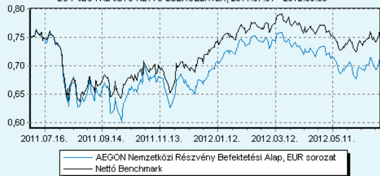
EGY JEGYRE JUTÓ NETTÓ ESZKÖZÉRTÉK, 2011.07.01 - 2012.06.30

Az alapok múltbeli teljesítménye nem nyújt garanciát a jövőbeli hozamok nagyságára. Jelen hirdetés nem minősül ajánlattételnek vagy befektetési tanácsadásnak. A befektetés részletes feltételeit az Alap Tájékoztatója tartalmazza, mely a mindenkor érvényes kondíciós listákkal együtt megtalálható a forgalmazási helyeken. A befektetési alap forgalmazásával (vétel, tartás, eladás) kapcsolatos költségek az alap kezelési szabályzatában és a forgalmazási helyeken megismerhetők.