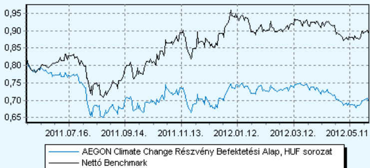
EGY JEGYRE JUTÓ NETTÓ ESZKÖZÉRTÉK, 2011.06.01 - 2012.05.31

Az alapok múltbeli teljesítménye nem nyújt garanciát a jövőbeli hozamok nagyságára. Jelen hirdetés nem minősül ajánlattételnek vagy befektetési tanácsadásnak. A befektetés részletes feltételeit az Alap Tájékoztatója tartalmazza, mely a mindenkor érvényes kondíciós listákkal együtt megtalálható a forgalmazási helyeken. A befektetési alap forgalmazásával (vétel, tartás, eladás) kapcsolatos költségek az alap kezelési szabályzatában és a forgalmazási helyeken megismerhetők.