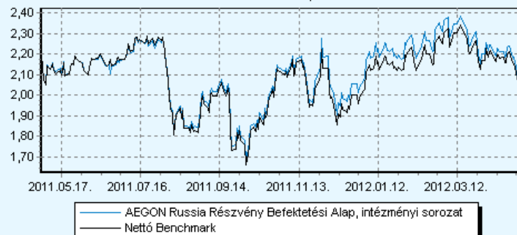
EGY JEGYRE JUTÓ NETTÓ ESZKÖZÉRTÉK, 2011.05.01 - 2012.04.30

Az alapok múltbeli teljesítménye nem nyújt garanciát a jövőbeli hozamok nagyságára. Jelen hirdetés nem minősül ajánlattételnek vagy befektetési tanácsadásnak. A befektetés részletes feltételeit az Alap Tájékoztatója tartalmazza, mely a mindenkor érvényes kondíciós listákkal együtt megtalálható a forgalmazási helyeken. A befektetési alap forgalmazásával (vétel, tartás, eladás) kapcsolatos költségek az alap kezelési szabályzatában és a forgalmazási helyeken megismerhetők.