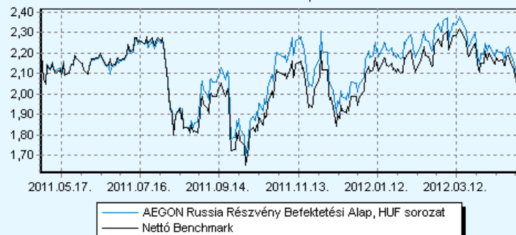
EGY JEGYRE JUTÓ NETTÓ ESZKÖZÉRTÉK, 2011.05.01 - 2012.04.30

Az alapok múltbeli teljesítménye nem nyújt garanciát a jövőbeli hozamok nagyságára. Jelen hirdetés nem minősül ajánlattételnek vagy befektetési tanácsadásnak. A befektetés részletes feltételeit az Alap Tájékoztatója tartalmazza, mely a mindenkor érvényes kondíciós listával együtt megtalálható a forgalmazási helyeken. A befektetési alap forgalmazásával (vétel, tartás, eladás) kapcsolatos költségek az alap kezelési szabályzatában és a forgalmazási helyeken megismerhetők.