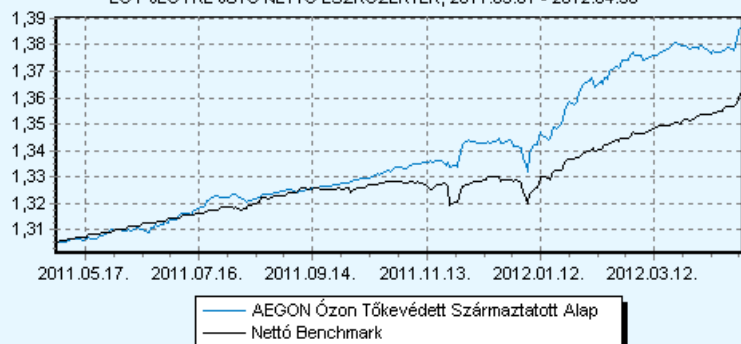
EGY JEGYRE JUTÓ NETTÓ ESZKÖZÉRTÉK, 2011.05.01 - 2012.04.30

Az alapok múltbeli teljesítménye nem nyújt garanciát a jövőbeli hozamok nagyságára. Jelen hirdetés nem minősül ajánlattételnek vagy befektetési tanácsadásnak. A befektetés részletes feltételeit az Alap Tájékoztatója tartalmazza, mely a mindenkor érvényes kondíciós listákkal együtt megtalálható a forgalmazási helyeken. A befektetési alap forgalmazásával (vétel, tartás, eladás) kapcsolatos költségek az alap kezelési szabályzatában és a forgalmazási helyeken megismerhetők.