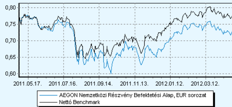
EGY JEGYRE JUTÓ NETTÓ ESZKÖZÉRTÉK, 2011.05.01 - 2012.04.30

Az alapok múltbeli teljesítménye nem nyújt garanciát a jövőbeli hozamok nagyságára. Jelen hirdetés nem minősül ajánlattételnek vagy befektetési tanácsadásnak. A befektetés részletes feltételeit az Alap Tájékoztatója tartalmazza, mely a mindenkor érvényes kondíciós listákkal együtt megtalálható a forgalmazási helyeken. A befektetési alap forgalmazásával (vétel, tartás, eladás) kapcsolatos költségek az alap kezelési szabályzatában és a forgalmazási helyeken megismerhetők.