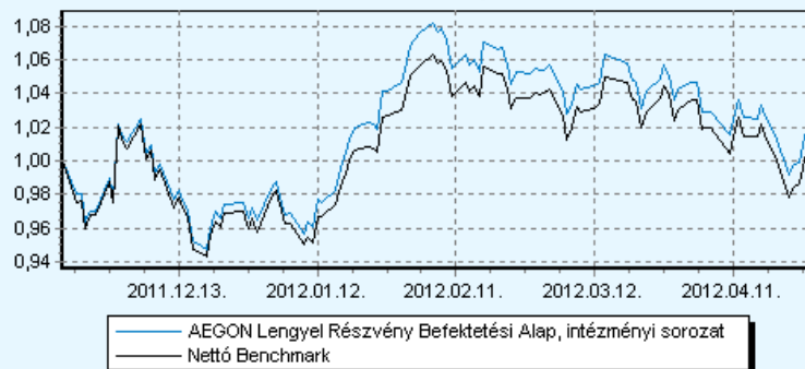
EGY JEGYRE JUTÓ NETTÓ ESZKÖZÉRTÉK, 2011.05.01 - 2012.04.30

Az alapok múltbeli teljesítménye nem nyújt garanciát a jövőbeli hozamok nagyságára. Jelen hirdetés nem minősül ajánlattételnek vagy befektetési tanácsadásnak. A befektetés részletes feltételeit az Alap Tájékoztatója tartalmazza, mely a mindenkor érvényes kondíciós listákkal együtt megtalálható a forgalmazási helyeken. A befektetési alap forgalmazásával (vétel, tartás, eladás) kapcsolatos költségek az alap kezelési szabályzatában és a forgalmazási helyeken megismerhetők.