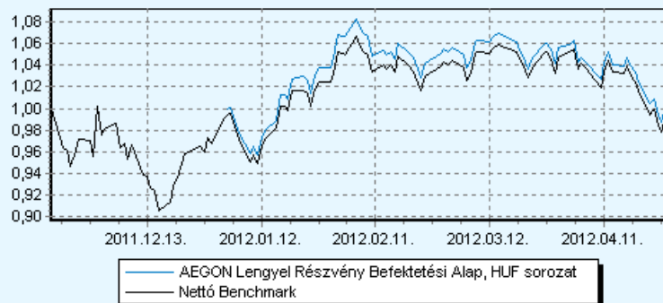
EGY JEGYRE JUTÓ NETTÓ ESZKÖZÉRTÉK, 2011.05.01 - 2012.04.30

Az alapok múltbeli teljesítménye nem nyújt garanciát a jövőbeli hozamok nagyságára. Jelen hirdetés nem minősül ajánlattételnek vagy befektetési tanácsadásnak. A befektetés részletes feltételeit az Alap Tájékoztatója tartalmazza, mely a mindenkor érvényes kondíciós listákkal együtt megtalálható a forgalmazási helyeken. A befektetési alap forgalmazásával (vétel, tartás, eladás) kapcsolatos költségek az alap kezelési szabályzatában és a forgalmazási helyeken megismerhetők.