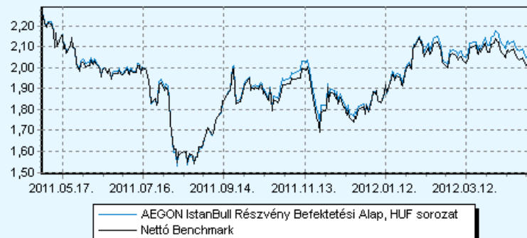
EGY JEGYRE JUTÓ NETTÓ ESZKÖZÉRTÉK, 2011.05.01 - 2012.04.30

Az alapok múltbeli teljesítménye nem nyújt garanciát a jövőbeli hozamok nagyságára. Jelen hirdetés nem minősül ajánlattételnek vagy befektetési tanácsadásnak. A befektetés részletes feltételeit az Alap Tájékoztatója tartalmazza, mely a mindenkor érvényes kondíciós listával együtt megtalálható a forgalmazási helyeken. A befektetési alap forgalmazásával (vétel, tartás, eladás) kapcsolatos költségek az alap kezelési szabályzatában és a forgalmazási helyeken megismerhetők.