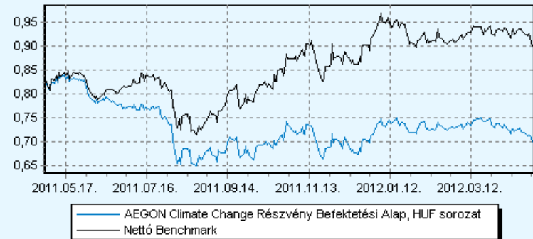
EGY JEGYRE JUTÓ NETTÓ ESZKÖZÉRTÉK, 2011.05.01 - 2012.04.30

Az alapok múltbeli teljesítménye nem nyújt garanciát a jövőbeli hozamok nagyságára. Jelen hirdetés nem minősül ajánlattételnek vagy befektetési tanácsadásnak. A befektetés részletes feltételeit az Alap Tájékoztatója tartalmazza, mely a mindenkor érvényes kondíciós listákkal együtt megtalálható a forgalmazási helyeken. A befektetési alap forgalmazásával (vétele, tartás, eladás) kapcsolatos költségek az alap kezelési szabályzatában és a forgalmazási helyeken megismerhetők.