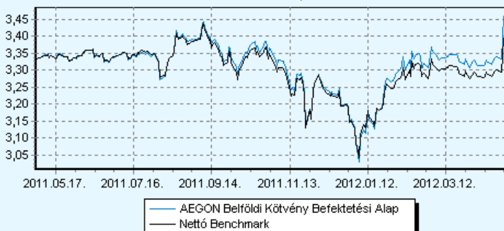
EGY JEGYRE JUTÓ NETTÓ ESZKÖZÉRTÉK, 2011.05.01 - 2012.04.30

Az alapok múltbeli teljesítménye nem nyújt garanciát a jövőbeli hozamok nagyságára. Jelen hirdetés nem minősül ajánlattételnek vagy befektetési tanácsadásnak. A befektetés részletes feltételeit az Alap Tájékoztatója tartalmazza, mely a mindenkor érvényes kondíciós listákkal együtt megtalálható a forgalmazási helyeken. A befektetési alap forgalmazásával (vétel, tartás, eladás) kapcsolatos költségek az alap kezelési szabályzatában és a forgalmazási helyeken megismerhetők.