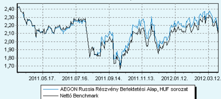
EGY JEGYRE JUTÓ NETTÓ ESZKÖZÉRTÉK, 2011.04.01 - 2012.03.31

Az alapok múltbeli teljesítménye nem nyújt garanciát a jövőbeli hozamok nagyságára. Jelen hirdetés nem minősül ajánlattételnek vagy befektetési tanácsadásnak. A befektetés részletes feltételeit az Alap Tájékoztatója tartalmazza, mely a mindenkor érvényes kondíciós listákkal együtt megtalálható a forgalmazási helyeken. A befektetési alap forgalmazásával (vétel, tartás, eladás) kapcsolatos költségek az alap kezelési szabályzatában és a forgalmazási helyeken megismerhetők.