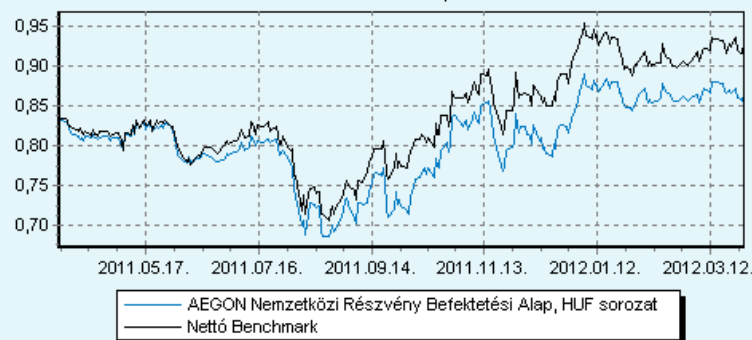
EGY JEGYRE JUTÓ NETTÓ ESZKÖZÉRTÉK, 2011.04.01 - 2012.03.31

Az alapok múltbeli teljesítménye nem nyújt garanciát a jövőbeli hozamok nagyságára. Jelen hirdetés nem minősül ajánlattételnek vagy befektetési tanácsadásnak. A befektetés részletes feltételeit az Alap Tájékoztatója tartalmazza, mely a mindenkor érvényes kondíciós listákkal együtt megtalálható a forgalmazási helyeken. A befektetési alap forgalmazásával (vétel, tartás, eladás) kapcsolatos költségek az alap kezelési szabályzatában és a forgalmazási helyeken megismerhetők.