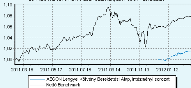
EGY JEGYRE JUTÓ NETTÓ ESZKÖZÉRTÉK, 2011.03.01 - 2012.02.29

Az alapok múltbéli teljesítménye nem nyújt garanciát a jövőbeli hozamok nagyságára. Jelen hirdetés nem minősül ajánlattételnek vagy befektetési tanácsadásnak. A befektetés részletes feltételeit az Alap Tájékoztatója tartalmazza, mely a mindenkor érvényes kondíciós listákkal együtt megtalálható a forgalmazási helyeken. A befektetési alap forgalmazásával (vétel, tartás, eladás) kapcsolatos költségek az alap kezelési szabályzatában és a forgalmazási helyeken megismerhetők.