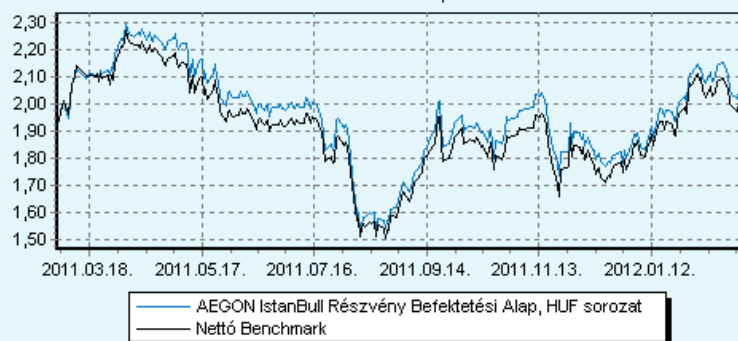
EGY JEGYRE JUTÓ NETTÓ ESZKÖZÉRTÉK, 2011.03.01 - 2012.02.29

Az alapok múltbeli teljesítménye nem nyújt garanciát a jövőbeli hozamok nagyságára. Jelen hirdetés nem minősül ajánlattételnek vagy befektetési tanácsadásnak. A befektetés részletes feltételeit az Alap Tájékoztatója tartalmazza, mely a mindenkor érvényes kondíciós listákkal együtt megtalálható a forgalmazási helyeken. A befektetési alap forgalmazásával (vétel, tartás, eladás) kapcsolatos költségek az alap kezelési szabályzatában és a forgalmazási helyeken megismerhetők.