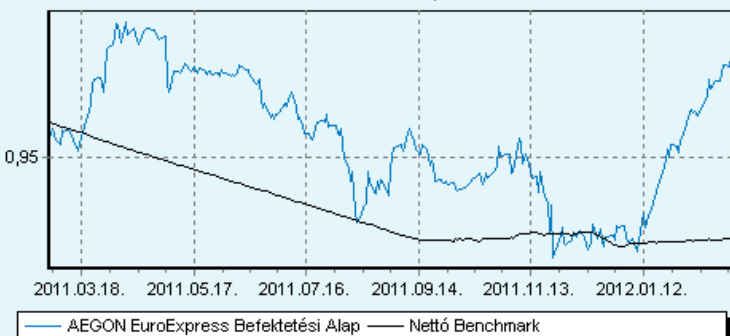
EGY JEGYRE JUTÓ NETTÓ ESZKÖZÉRTÉK, 2011.03.01 - 2012.02.29

Az alapok múltbeli teljesítménye nem nyújt garanciát a jövőbeli hozamok nagyságára. Jelen hirdetés nem minősül ajánlattételnek vagy befektetési tanácsadásnak. A befektetés részletes feltételeit az Alap Tájékoztatója tartalmazza, mely a mindenkor érvényes kondíciós listákkal együtt megtalálható a forgalmazási helyeken. A befektetési alap forgalmazásával (vétel, tartás, eladás) kapcsolatos költségek az alap kezelési szabályzatában és a forgalmazási helyeken megismerhetők.