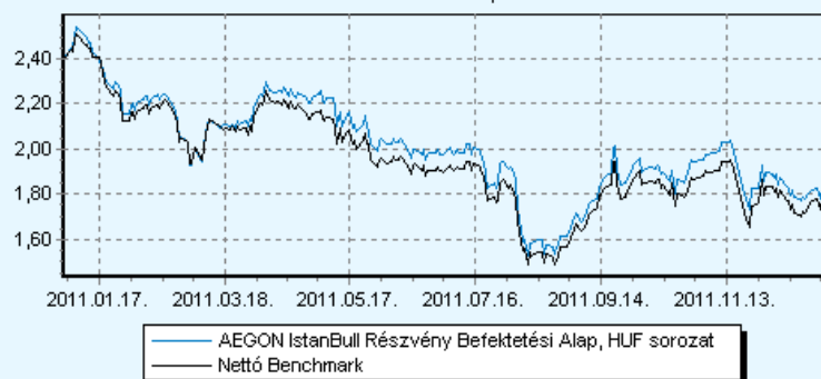
EGY JEGYRE JUTÓ NETTÓ ESZKÖZÉRTÉK, 2011.01.01 - 2011.12.31

Az alapok múltbeli teljesítménye nem nyújt garanciát a jövőbeli hozamok nagyságára. Jelen hirdetés nem minősül ajánlattételnek vagy befektetési tanácsadásnak. A befektetés részletes feltételeit az Alap Tájékoztatója tartalmazza, mely a mindenkor érvényes kondíciós listákkal együtt megtalálható a forgalmazási helyeken. A befektetési alap forgalmazásával (vétel, tartás, eladás) kapcsolatos költségek az alap kezelési szabályzatában és a forgalmazási helyeken megismerhetők.